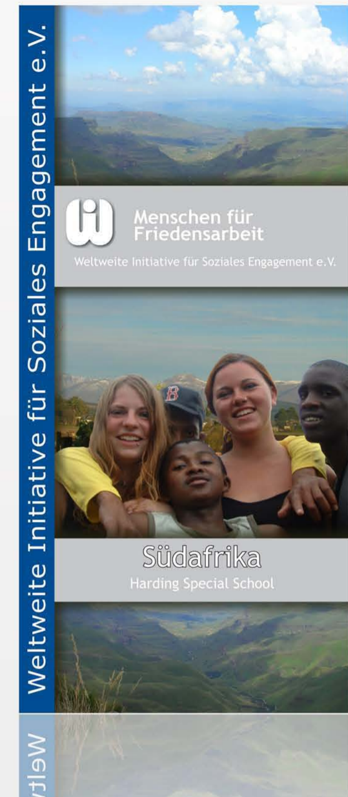
Alle Elemente Schein mit Schein