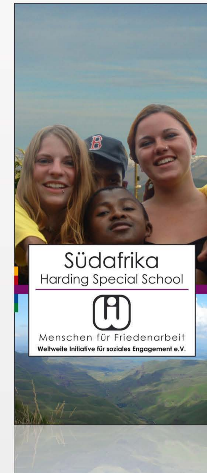
neues Layout unten