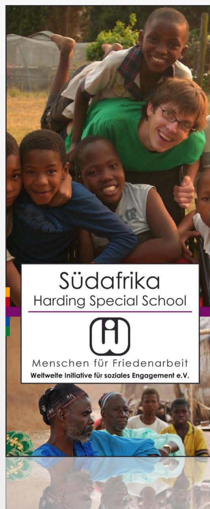
neues Layout unten