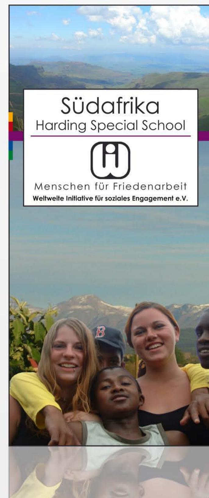
neues Layout oben