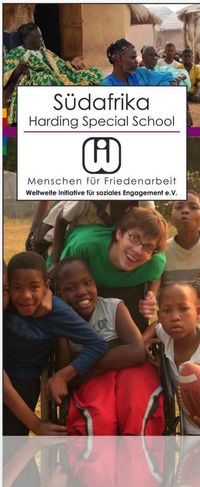
neues Layout oben